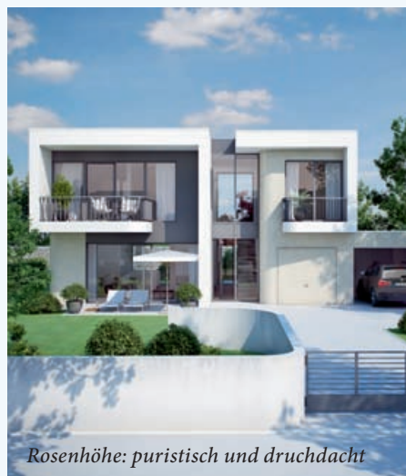
Rosenhöhe: puristisch und durchdacht

Die 30 Grundstücke haben zwischen 600 und 950 Quadratmeter und sind damit um einiges größer als gewöhnliche Gärten von Ein-Familien-Häusern in der Stadt. Um die Großzügigkeit einer Parklandschaft zu unterstützen, werden die Gärten und die Außenanlage zusammen mit einem Freiflächenplaner konzipiert und realisiert. Die Rosenbaumhöhe verfügt zusätzlich über zwei schöne, quartierseigene Plätze, die zum Verweilen einladen und zum Treffpunkt für die Quartiersbewohner werden können.