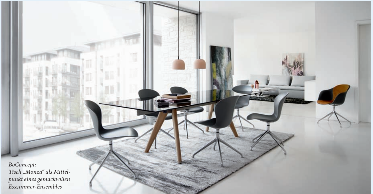
BoConcept: Tisch „Monza“ als Mittel- punkt eines gemackvollen Esszimmer-Ensembles