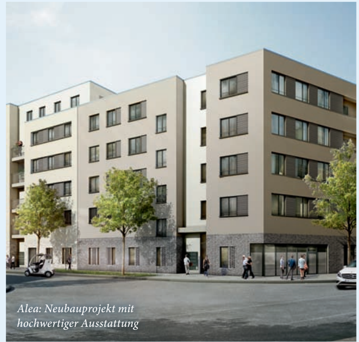
Alea: Neubauprojekt mit hochwertiger Ausstattung