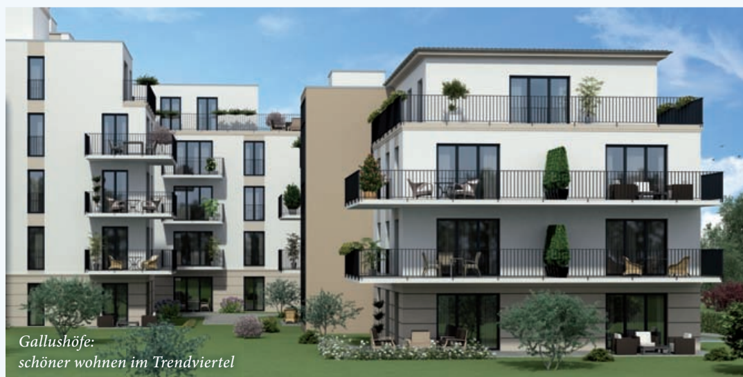
Gallushöfe: schöner wohnen im Trendviertel

Bei den Projekten handelt es sich um das sogenannte schwellenlose Wohnen. Man gelangt ohne Stufen in die Gebäude und in die Wohnungen. Damit werden die Anforderungen und Ansprüche der Klientel 50+ und 60+ erfüllt. Sofern Interessenten weitere Wünsche hinsichtlich des barrierefreien Wohnens haben, können diese im Rahmen der Bauausführung noch umgesetzt werden.